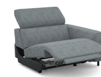
B150ER (109 cm x 78 cm x 112 cm)