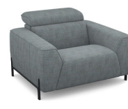
C100 (119 cm x 78 cm x 112 cm)