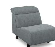
E100 (68 cm x 78 cm x 112 cm)