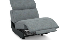
E100EL (68 cm x 78 cm x 112 cm)