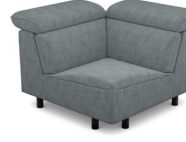
EK01 (110 cm x 78 cm x 110 cm)