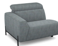
B150L (109 cm x 78 cm x 112 cm)