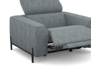
FIEL (85 cm x 78 cm x 112 cm)