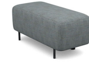
P010L (43 cm x 47 cm x 105 cm)