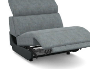
E150EL (85 cm x 78 cm x 112 cm)