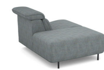
IS00L (112 cm x 78 cm x 135 cm)