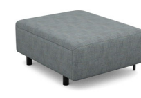
P000R (82 cm x 47 cm x 105 cm)