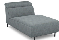
CH00R (87 cm x 78 cm x 176 cm)