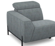
B100L (93 cm x 78 cm x 112 cm)