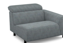
B150R (109 cm x 78 cm x 112 cm)