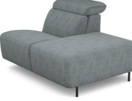
IS00R (112 cm x 78 cm x 135 cm)