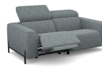
C2EL (186 cm x 78 cm x 112 cm)