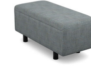
P010 (43 cm x 47 cm x 105 cm)