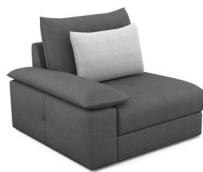
B100L (104 cm x 86 cm x 109 cm)