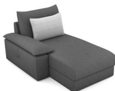
CH00L (108 cm x 86 cm x 172 cm)