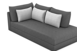
T00R (112 cm x 86 cm x 229 cm)