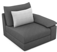
B100R (104 cm x 86 cm x 109 cm)