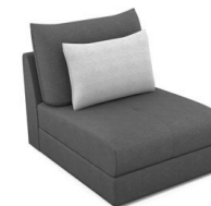
E100 (81 cm x 86 cm x 109 cm)