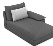
CH00R (108 cm x 86 cm x 172 cm)