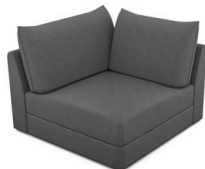
EK00 (111 cm x 86 cm x 111 cm)