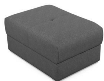
P000 (58 cm x 42 cm x 84 cm)