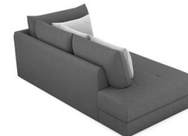
T00L (112 cm x 86 cm x 229 cm)