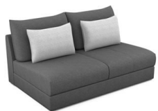
E250 (162 cm x 86 cm x 109 cm)