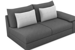
B250R (185 cm x 86 cm x 109 cm)